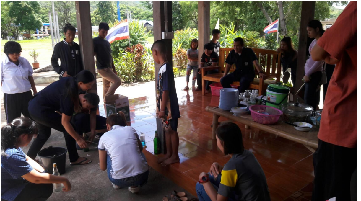
จัดกิจกรรมการเรียนรู้ที่หลากหลายและใช้สื่อเทคโนโลยี