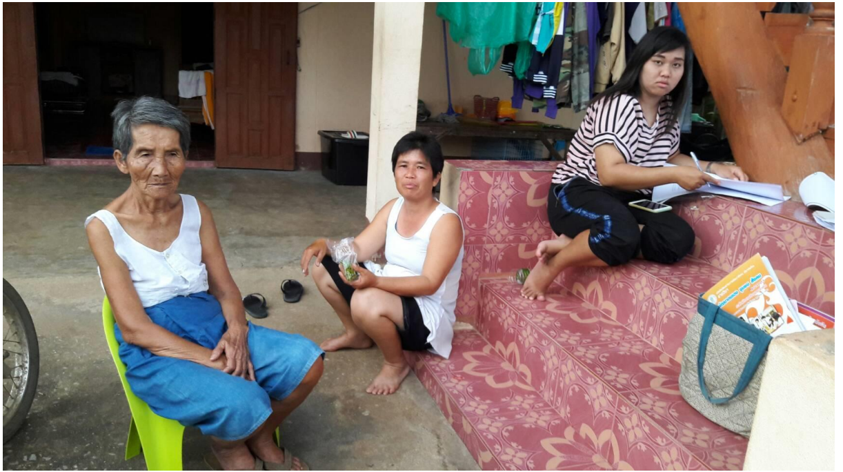
ติดตามเยี่ยมบ้านนักศึกษาพบปะผู้ปกครองสร้างความเข้าใจแก้ไขปัญหาาร่วมกัน