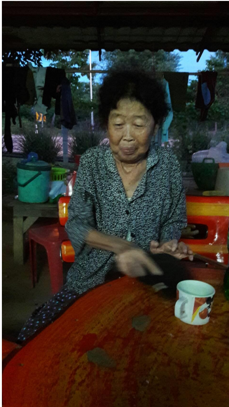
พบปะผู้ปกครองสร้างความเข้าใจในการแก้ปัญหาาร่วมกัน