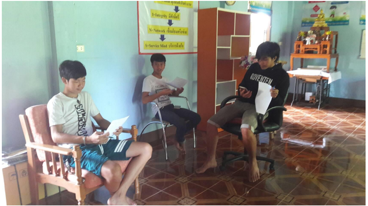
จัดกิจกรรมที่ยืดหยุ่น บรรยากาศเป็นกันเอง ใช้สื่อการเรียนรู้ใกล้ตัว