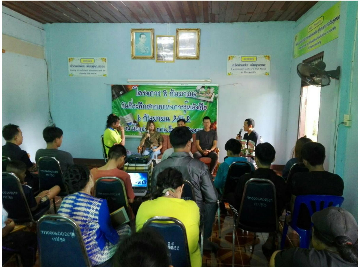
เปิดโอกาสการเรียนรู้ ยกย่องเชิดชูคนดีเป็นแบบอย่างและสร้างขวัญกำลังใจ