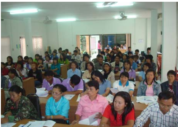
อบรมให้ความรู้อาสาสมัคร กศน.เพื่อดำเนินกิจกรรมชุมชนรักการอ่าน

สืบเนื่องจากการที่รัฐบาลประกาศวาระแห่งชาติเรื่องการส่งเสริมการอ่านเมื่อวันที่ 29 มีนาคม 2552 และได้กำหนดให้วันที่ 2 เมษายนของทุกปีเป็น “วันแห่งการรักการอ่าน” และจังหวัดลำปาง ได้ประกาศวาระแห่งจังหวัดลำปาง เรื่องการส่งเสริมการอ่านสอดคล้องกับนโยบายและจุดเน้นการดำเนินงาน จัด ส่งเสริม และสนับสนุนการศึกษาจากระบบและการศึกษาตามอัธยาศัย ของสำนักงาน กศน. ที่เน้นการพัฒนา รูปแบบและวิธีการ จัดการศึกษาให้สอดคล้องกับเจตนารมณ์ของ พรบ.การศึกษาจากระบบและการศึกษาตามอัธยาศัย พ.ศ. 2551 ซึ่งสำนักงาน กศน.จังหวัดลำปาง ได้จัดกิจกรรมส่งเสริม “ชุมชนรักการอ่าน” ขึ้น ตั้งแต่ปี 2551 เป็นต้นมา โดยให้สถานศึกษาในสังกัด ดำเนินงานในพื้นที่รับผิดชอบ เพื่อตอบสนองต่อสภาพปัญหาและความต้องการของประชาชนและชุมชนท้องถิ่น ตลอดจนส่งเสริมและพัฒนาบุคลากรผู้ปฏิบัติงานให้มีศักยภาพมากยิ่งขึ้น ผ่านการจัดกิจกรรมส่งเสริมให้ประชาชนรักการอ่าน ซึ่งเป็นการปลูกฝังลักษณะนิสัยรักการอ่าน ใฝ่การเรียนรู้ตลอดชีวิต และจำเป็นอย่างยิ่งที่ต้องมีการจัดกิจกรรมอย่างสม่ำเสมอและต่อเนื่อง กศน.ตำบล แต่ละแห่ง ร่วมกับ กศน.อำเภอและห้องสมุดประชาชน จึงได้ร่วมกันดำเนินกิจกรรมในการส่งเสริมการอ่าน หลากหลายกิจกรรม เพื่อส่งเสริมให้มีการสร้างบรรยากาศและสิ่งแวดล้อมที่เอื้อต่อการอ่านให้เกิดขึ้น โดยสนับสนุนการพัฒนาแหล่งการอ่านในชุมชนให้เกิดขึ้นอย่างกว้างขวางและหลากหลาย รวมทั้งมีความพร้อมในด้านสื่ออุปกรณ์ที่สนับสนุนการอ่าน และจัดกิจกรรมเพื่อส่งเสริมการอ่านที่หลากหลาย