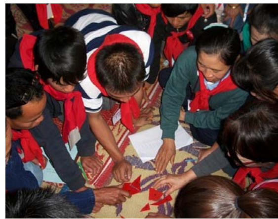
ค่ายยุวภาค กศน.