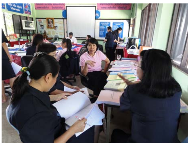
พัฒนาระบบประกันคุณภาพภายใน กศน.โดยระบบพี่เลี้ยง