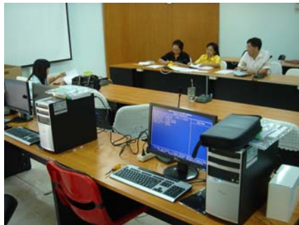
การเปิดช่องสอบราคาคอมพิวเตอร์

สำนักงาน กศน.จังหวัดลำปาง สามารถดำเนินการจัดหาที่ดินก่อสร้างอาคาร กศน.ตำบล และจัดสิทธิเหนือพื้นดินได้ครบทั้ง 12 แห่งตามที่ได้รับจัดสรรงบประมาณ ปี 2554 และหาบริษัทรับจ้างและทำสัญญาจ้างก่อสร้างอาคาร กศน.ตำบล ที่มีความพร้อมได้ครบทุกแห่ง จำนวน 8 บริษัท