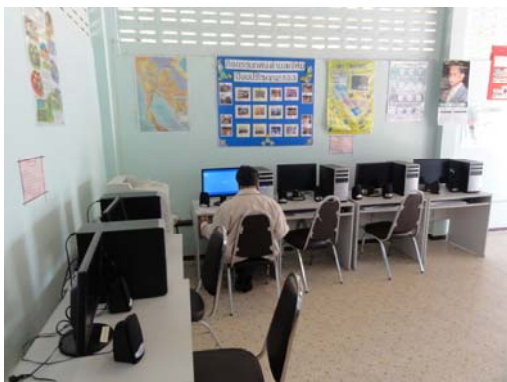
จัด มุม ICT ไว้บริการใน กศน.ตำบล