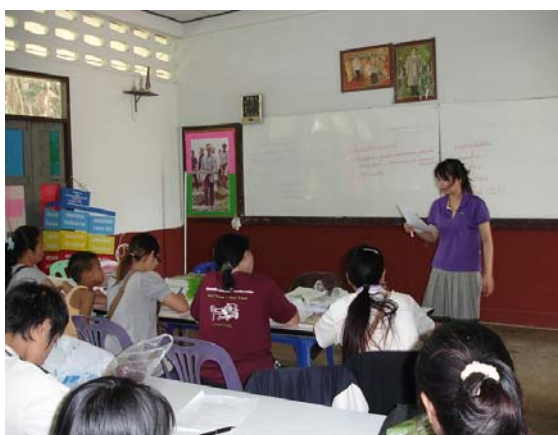
สอนเสริมภาษาอังกฤษ