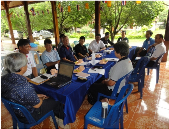
ข้อมูลในพื้นที่เป้าหมาย 5 ชุมชน