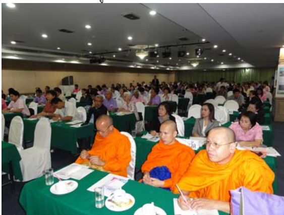
บุคลากร จากหน่วยงานระดับจังหวัด องค์กรปกครองส่วนท้องถิ่น ทั้งระดับเทศบาลและ อบต. องค์กรภาคเอกชนเข้าร่วมประชุม ฯ