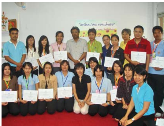
การพัฒนา ครู ศรช. ใหม่ก่อนลงพื้นที่ กศน.อำเภอ