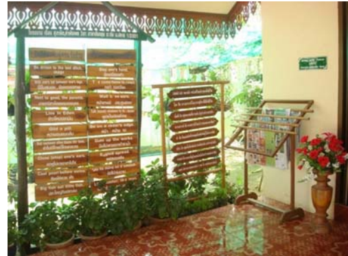
สภาพภายใน กศน.ตำบล ในการให้บริการ