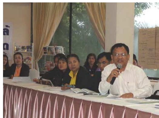
ภาพกิจกรรมการประชุมปฏิบัติการจัดทำตัวชี้วัด กศน. ปี 2554