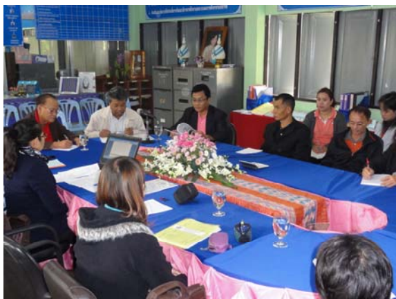
นิเทศ กำกับ ติดตามโดยคณะทำงาน พัฒนาระบบประกันภายใน

3. สถานศึกษาในสังกัดสำนักงาน กศน.จังหวัดลำปาง จำนวน 9 แห่ง (เมืองลำปาง/เกาะคา/แม่ทะ/แม่เมาะ/ห้างฉัตร/วังเหนือ/เมืองปาน/เสริมงาม/สบปราบ) ที่ผ่านเกณฑ์การประเมิน สมศ. มีการผุดงและพัฒนาระบบการประกันคุณภาพอย่างต่อเนื่อง