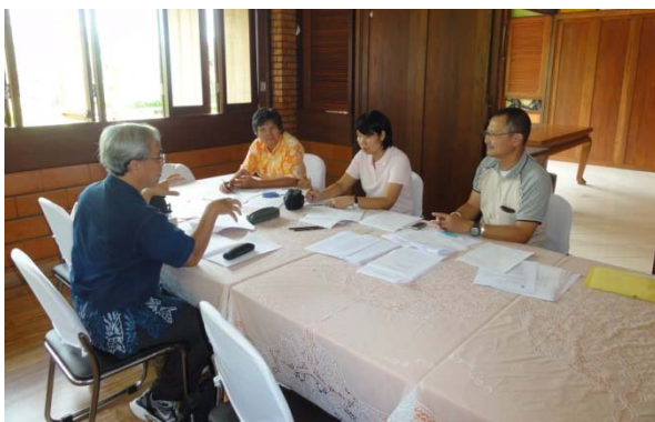
กลุ่มภาคีเครือข่ายสรุปผลการประเมิน