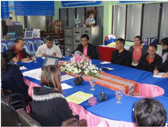
นิเทศ กำกับ ติดตามโดยคณะทำงาน พัฒนาระบบประกันภายใน

- ส่งเสริม สนับสนุนการพัฒนาระบบประกันภายในของ กศน. อำเภอ ที่ยังมีปัญหาโดยใช้การประเมินคุณภาพสถานศึกษาโดยต้นสังกัด ในการติดตาม กำกับ ดูแลและให้คำปรึกษา