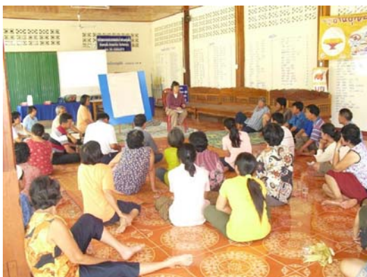
เชิญภาครัฐเครือข่ายจาก ม.ราชวมงคลลำปาง ร่วมจัดกิจกรรมให้ความรู้ในการผลิตเมล็ดพันธุ์ข้าว