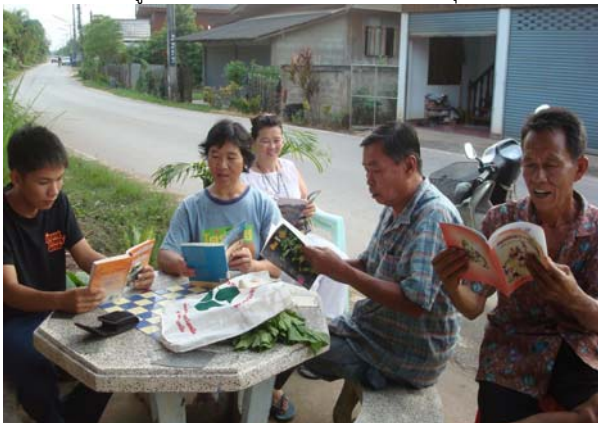
บริการตามแหล่งชุมชน