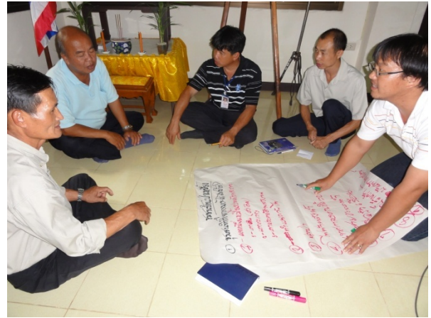
ครู กศน. ตำบลร่วมกับชุมชน วิเคราะห์ตนเองในการพัฒนาชุมชน โดยใช้หลักการเรียนรู้โดยชุมชนเป็นฐาน