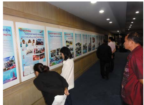
ผู้เข้าร่วมประชุมชมนิทรรศการยุทธศาสตร์การส่งเสริมการอ่าน