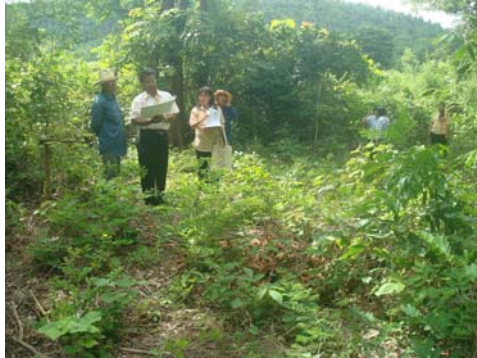
ผอ.ศุภกร ศรีศักดิ์ดา ตรวจสอบสถานที่ก่อสร้าง กศน.ตำบลแม่ะ

○ เป็นสำนักงานที่จัดตั้งขึ้นใหม่ ในปีงบประมาณ 2554 จำนวน 5 แห่ง คือ กศน.ตำบลกล้วยแพะ กศน.ตำบลเวียงเหนือ กศน.ตำบลหัวเวียง กศน.ตำบลสวนดอก และ กศน.ตำบลสบตุ๋ย ซึ่งเป็น กศน.ตำบลในเขตเทศบาลนครเมืองลำปาง