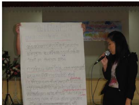
ภาพกิจกรรมแบ่งกลุ่มร่วมกันสรุปผลการดำเนินงานรอบปีที่ผ่านมา และวางแผนการดำเนินงานต่อไป