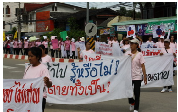
นักศึกษา กศน. เดินรณรงค์ประชาสัมพันธ์ต่อต้านยาเสพติดเนื่องในวันต่อต้านยาเสพติด