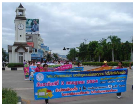
รณรงค์ประชาธิปไตย