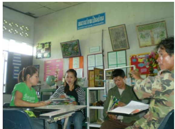
จัดตั้งชมรมว่างเป็นอ่าน