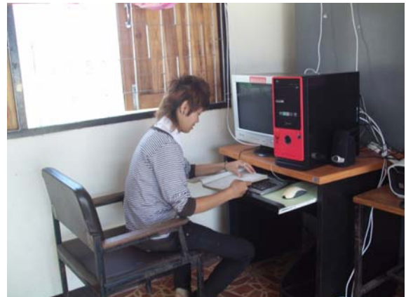
บริการสืบค้นคอมพิวเตอร์ ที่ กศน.ตำบล