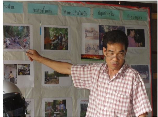
ผู้ใหญ่บ้านแป้นโป่งชัย อ.แจ้ห่ม กำลังให้ข้อมูล