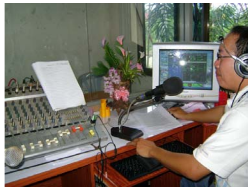
จัดรายการวิทยุชุมชน

http://www.nfekokha.org/nfekokha/index.php