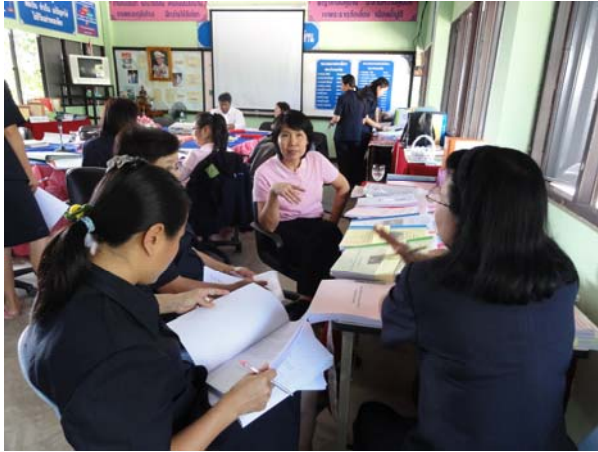
พัฒนาระบบประกันคุณภาพภายใน กศน.โดยระบบพี่เลี้ยง

2. สถานศึกษาในสังกัดสำนักงาน กศน.จังหวัดลำปาง จำนวน 4 แห่ง (แม่พริก/เถิน/แจ้ห่ม/งาว) ที่มีผลการประเมินภายนอกของสถานศึกษาไม่ผ่านเกณฑ์การประเมิน สมศ. มีการปรับแผนพัฒนาคุณภาพการศึกษาของสถานศึกษาและดำเนินการตามแผนการจัดการศึกษาของสถานศึกษาให้ได้คุณภาพตามมาตรฐานที่กำหนด