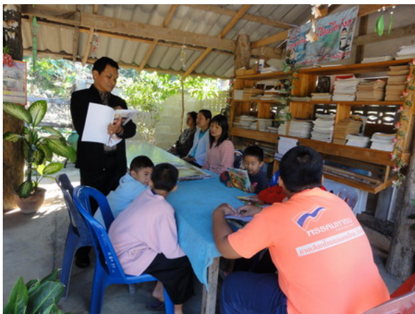
ประเมินต้นสังกัดในการพัฒนาระบบประกันภายใน