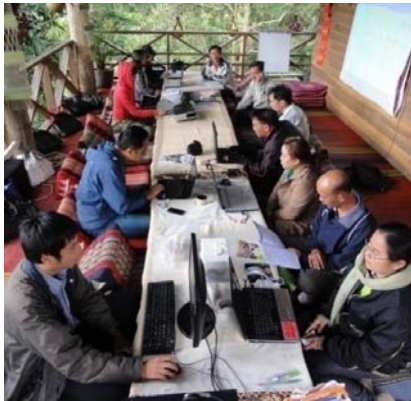
คณะทำงาน ไตรภาคี ร่วมกันทบทวนตนเองและมองไป ข้างหน้า

การมอบหมายงานแก่ผู้ที่มีความมุ่งมั่น ตั้งใจที่จะหันมาเรียนรู้ร่วมกัน ผ่านกลไกของการประชุมเพื่อ ทบทวนตนเองและมองไปข้างหน้าเป็นประจำทุกเดือน และลงมือปฏิบัติงานบางอย่างร่วมกันในพื้นที่ รวมทั้ง การประเมินผลสิ่งที่เกิดขึ้นอย่างต่อเนื่อง