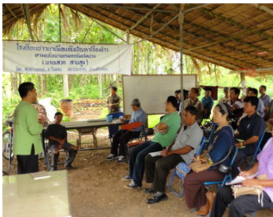
กิจกรรมแลกเปลี่ยนรู้ระหว่างชุมชนเศรษฐกิจพอเพียง

ด้านการส่งเสริมการเรียนการสอนภาษาอังกฤษ กิจกรรมปรับพื้นฐาน ภาษาอังกฤษให้กับนักศึกษาทุกระดับ ในหมวดวิชาหลัก จัดกิจกรรมสอนเสริมให้กับผู้เรียน โดย จัดค่ายวิชาการพัฒนาทักษะด้านภาษาอังกฤษให้แก่ผู้เรียน เช่น ค่ายวิชาการพัฒนาทักษะภาษาอังกฤษ “ชวนน้องแปล แชรร์น้องอ่าน” ให้แก่ผู้เรียน เป็นต้น