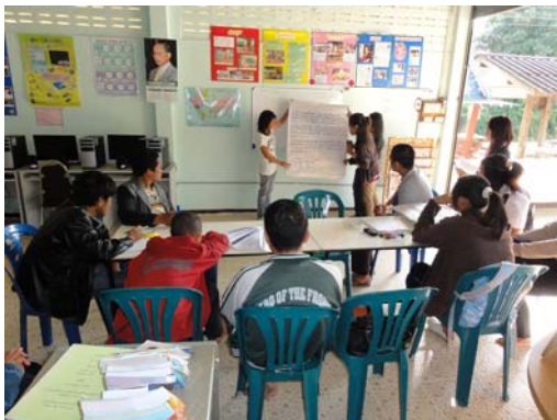
กิจกรรมการพบกลุ่มนักศึกษา กศน.

ส่งเสริมการมีส่วนร่วมของชุมชน ภาครัฐเครือข่าย เข้ามาร่วมตั้งแต่การวางแผนจัดกิจกรรมการเรียนรู้ การจัดกิจกรรม การนิเทศ ติดตามผลการดำเนินงานอย่างต่อเนื่อง และเน้นให้ชุมชนเห็นความสำคัญ ของ กศน.ตำบล เปรียบเสมือนงานของชุมชน โดยมีการดำเนินการสำรวจความต้องการของประชาชนในพื้นที่ก่อนการจัดกิจกรรม ทั้งในรูปแบบการใช้แบบสำรวจ และการจัดเวทีประชาคมในการจัดการศึกษาเพื่อพัฒนาอาชีพ ทักษะชีวิต พัฒนาสังคมและชุมชน