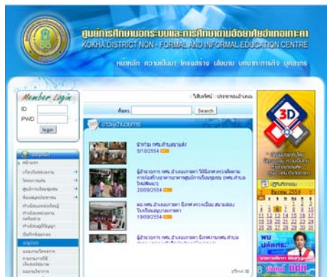
เว็บไซต์ กศน.อำเภอเกาะคา

http://www.nfekokha.org/nfekokha/index.php